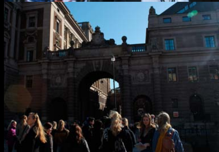
Folkmassor passerar riksdagen varje dag och beskådar den praktfulla byggnaden i centrala Stockholm.