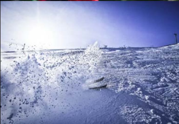
Slopestyle är en sport som är beroende av goda snöförhållanden, någonting som ibland begränsar Jonas när Piteå inte alltid är så snörikt.