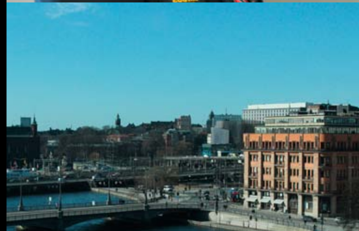
Den mäktiga utsikten över Stockholm och dess storslagna byggnader var något som snabbt fångade elevernas uppmärksamhet.