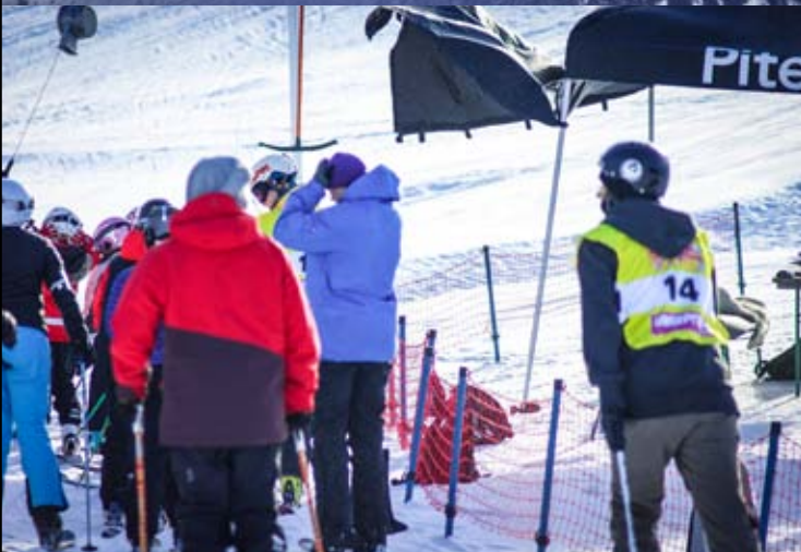
Intresset att prova på backen är stort hos besökarna under eventdagen på Lindbäcksstadion.