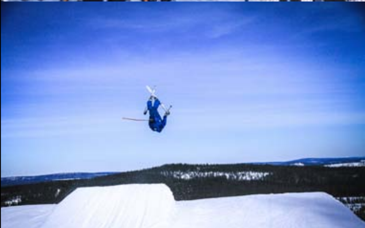
Här utför åkaren en "superman backflip" som är ett av många trick inom slopestyle.