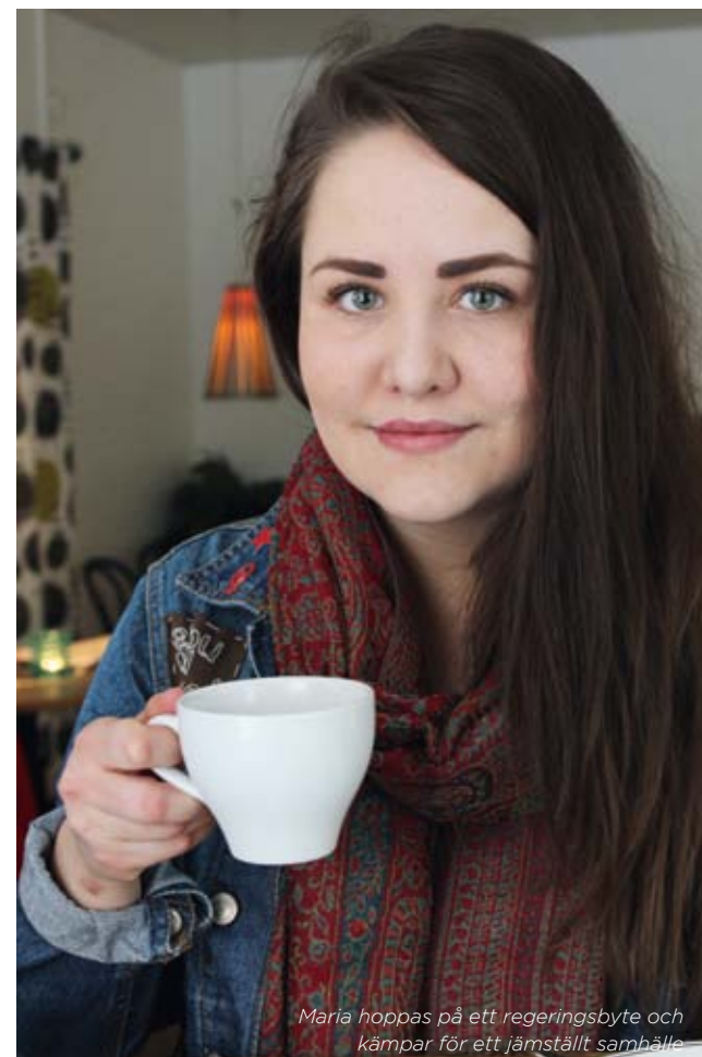
Maria hoppas på ett regeringsbyte och kämpar för ett jämställt samhälle.

Många som Maria möter är positiva till hennes politiska engagemang, trots hennes ålder, oavsett vilken politisk färg de har. De motgångar hon har mött har handlat om att hon är kvinna. Det kan vara svårt att vara tjej och politiker och hon har fått utstå en del elaka kommentarer. På grund av detta har Maria fått insyn i hur verkligheten ser ut och könsmaktsordningen blir tydligare för henne. När detta sägs blir jag fundersam och undrade om hon tror att hon gör skillnad, trots att hon är kvinna.