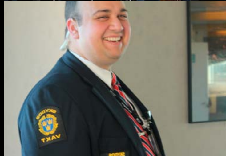
Inget prat, viskningar, applåder eller demonstrationer får förekomma i salen berättar vakten skämtsamt innan vi får kliva in i kammaren.