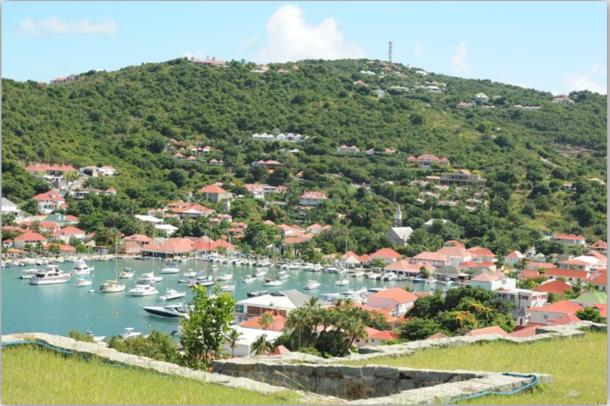
Vy över Gustavia