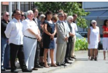
Många deltar i firandet