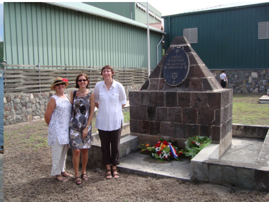
Ceremoni på kyrkogården