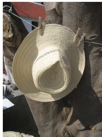
Handarbete i Corosoll