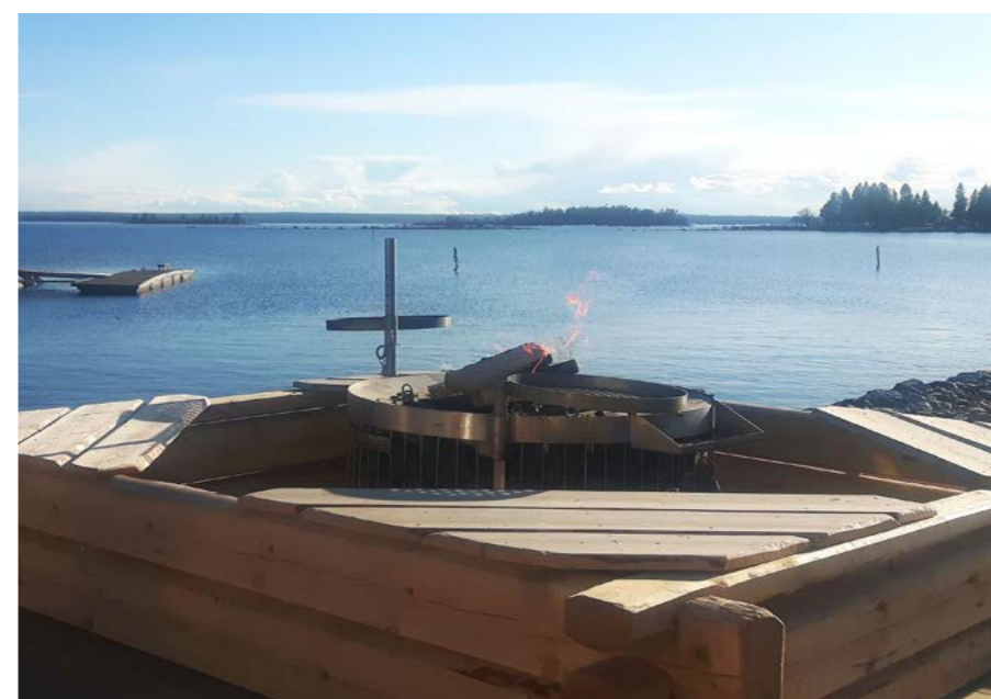
Utforska nya utflyktsmål, – den nya grillplatsen vid Bondökanalen.