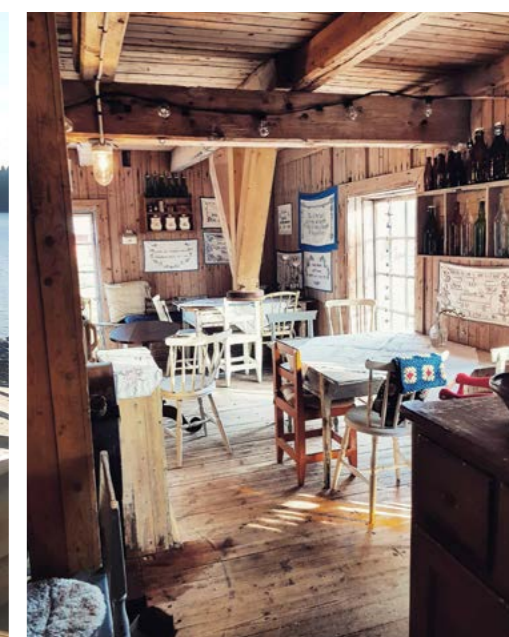
Kvarnkaféet i Jävre.

Dela dina sommarupplevelser med #pitecation