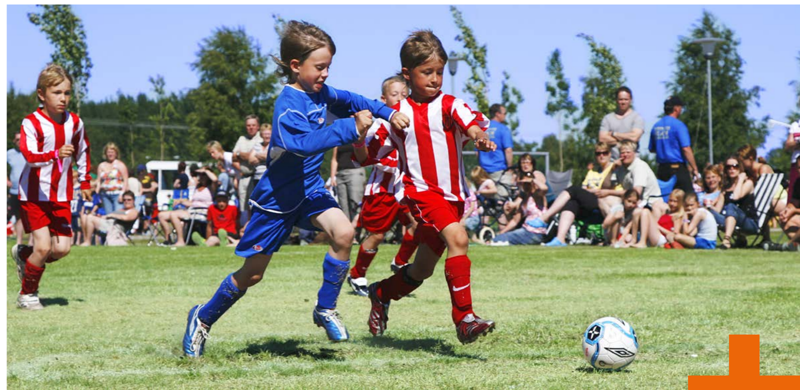
Att Piteå Summer Games ställts in innebär ett stort ekonomiskt bortfall för Piteås förenings- och näringsliv.

När coronaviruset slog till påverkades delar av näringslivet kraftfullt, främst inom handel, besöksnäring och kultur. Kunder och uppdrag minskade och evenemang ställdes in. Även föreningslivet drabbades hårt med inställda cuper, tävlingar och andra evenemang. Under april månad startades både Företagsakuten och Föreningsakuten med syfte att lindra effekterna av coronapandemin.