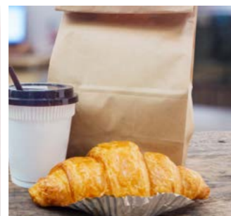
Take away.