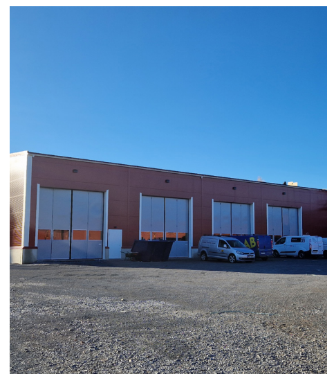
Vi bygger ny maskinhall inför höstterminen 2025

Maskiner och tekniks utrustning inom naturbruk nivå 1, 2 och 3